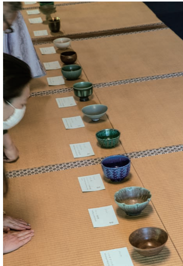
道具拜見では初めて見る北欧の陶磁器に興味津々のご様子